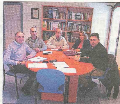
Momento de la reunión en la sede del CIMA

La reunión, en la que participaron también personal técnico del CIMA y de la propia MMS, sirvió tanto para definir las actividades que se desarrollarán con la financiación de dicha subvención, como para establecer la forma en la que se realizará la coordinación con la asistencia técnica que prestará apoyo a la Secretaría Técnica de la Red Local de Sostenibilidad de Cantabria (RLSC).