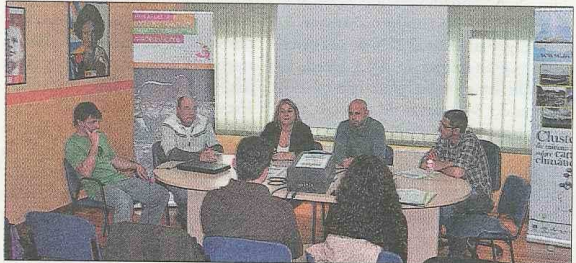
Momento de la jornada (foto sup.) y mesa Redonda con representantes municipales y emprendedores(foto inf.).